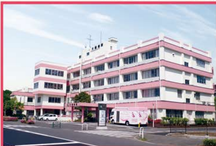
医療法人財団 逸生会 大橋病院