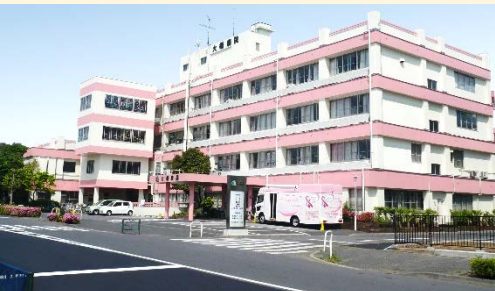
大橋病院 (東京都北区)