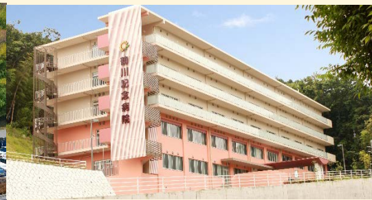
鶴川記念病院 (東京都町田市)

<神奈川県> たま日吉台病院・川崎みどりの病院 (川崎市) 特養) ヴィラージュ川崎 (川崎) 他